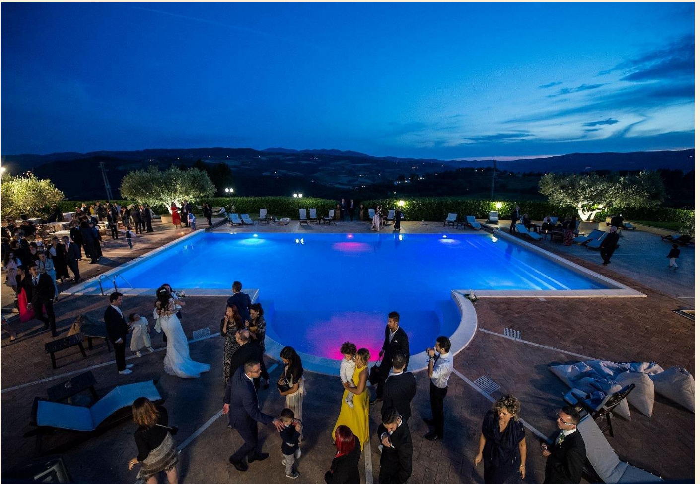
Både himlen og poolen er blå.