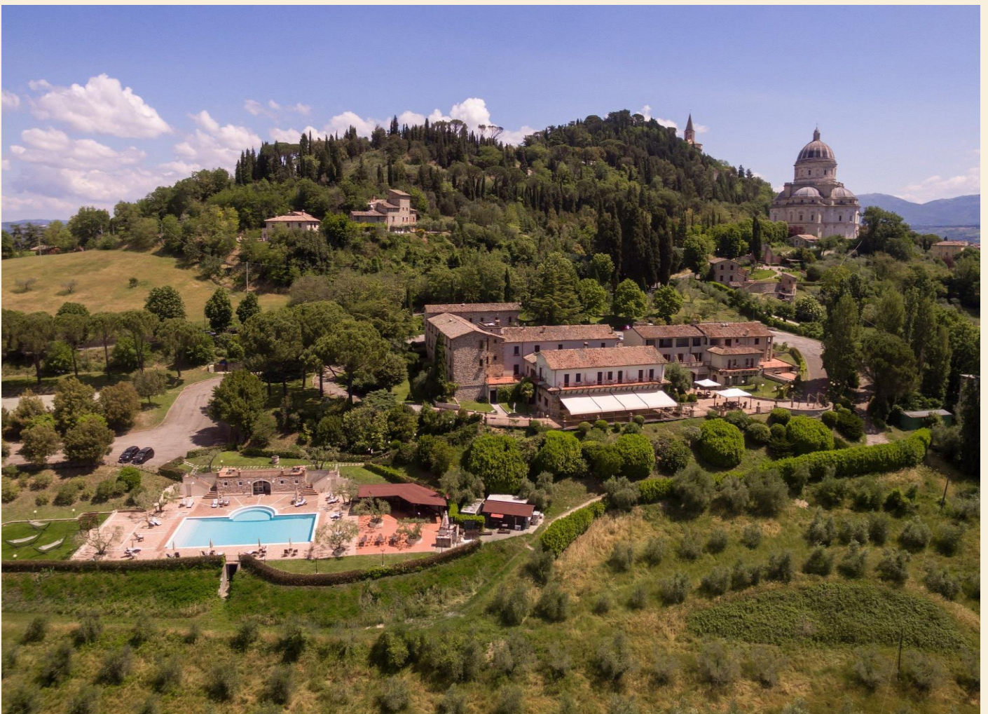
Hotel Bramante set fra luften