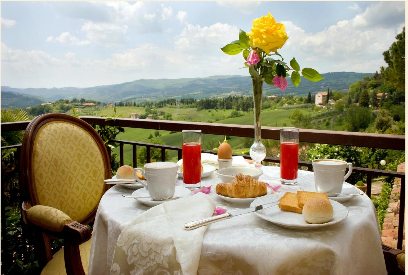
Morgenmaden kan efter aftale også nydes på terrassen