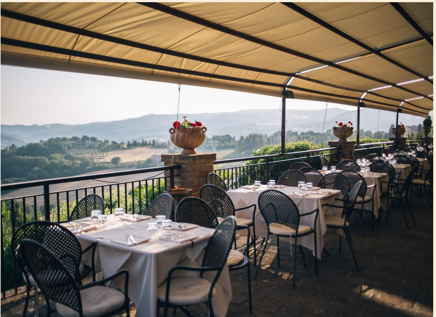
Tillader vejret det kan måltidet nydes med den vidunderlige udsigt